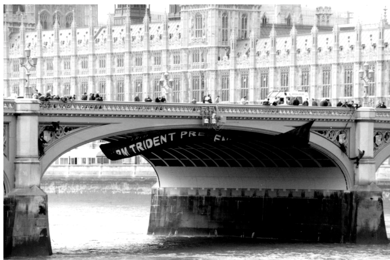
落ちない横断幕 - ロンドンでキャンペーン開始. 98年5月

人々を結束させるために必要なものである。政府当局による厳しい対応の可能性、つまり、核の違反行