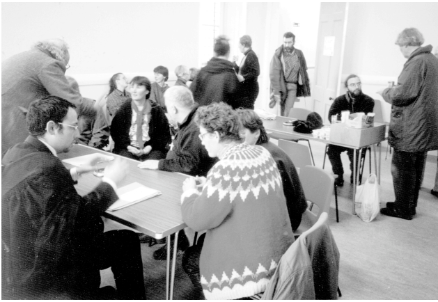
トライデント・プラウシェアズで混雑するヘレンズバラ地裁の受付ルーム

多くの活動家をモニターするための詳細な計画を練っていた。報道機関が政治家の存在に関心を持ち、記事にするために熱心に近づいてきた。少なくとも一人のジャーナリストは事の始まりから英国の核抑止力についての真実を詳細に説明してもらわなければならなかった。それだけの価値はあった。というのは、後に、そのジャーナリストはキャンペーン活動を報じる公平で堅実な記者となったからである。