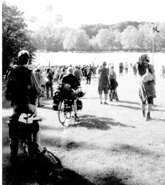
ブリュッセルに到着した平和行進. 1999年5月

として不十分である、と見解を述べた。ブライアンの件以外にも、スコットランドの下級裁判所における2件の有罪判決に対して抗告の申し立てが行われている。